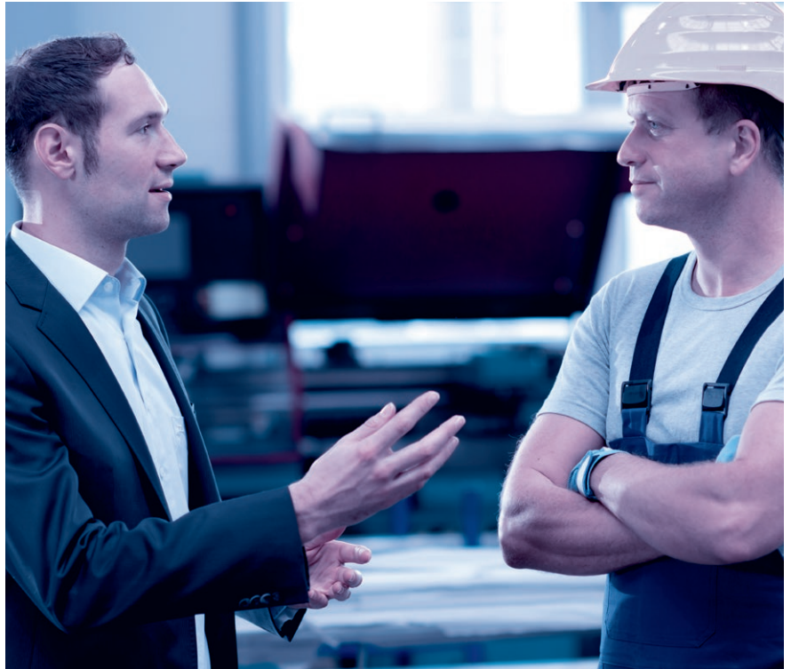
Das Mitarbeitergespräch ist keine Nebensache. Nehmen Sie sich Zeit und hören Sie zu.

Sinnvollerweise wird für das Mitarbeitergespräch zudem ein über die Jahre gleichbleibender Beurteilungsbogen mit einer Bewertungsskala (mit Smileys, Ampeln, Zahlen oder Buchstaben) verwendet.